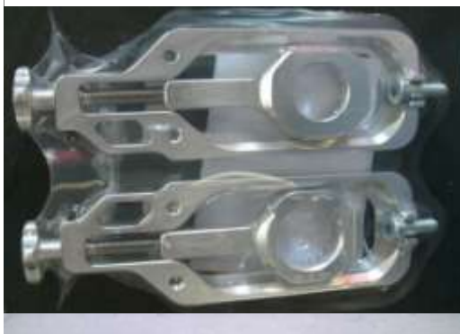
TENSOR DE CADENA PARA YAMAHA R1. 100€ N