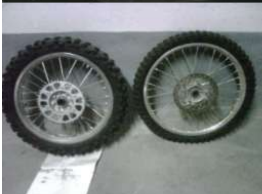
JUEGO DE LLANTAS ORIGINALES HONDA CRF 450 07. CON 1 SEMANA DE USO. 400€