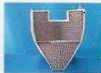
YAMAHA R6 / 07