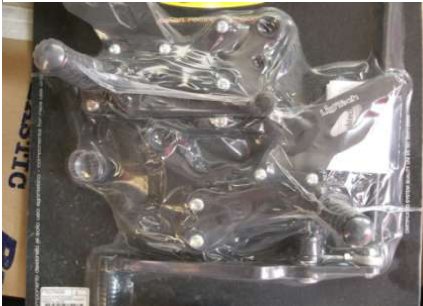
ESTRIBERAS DE CIRCUITO LIGHTECH YAMAHA R6 06- 09. REGULABLES. 350€ N.