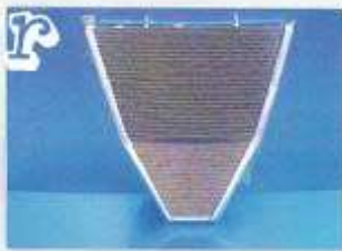
SUZUKI 600 K6/K7

radiadores completos 1200€, de quilla 500€, kit de montaje opcional algunos modelos 110€, precios netos.