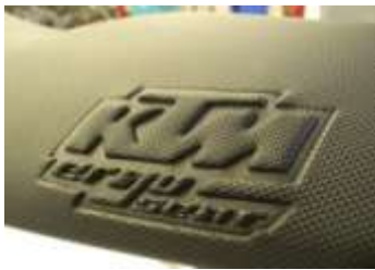
FUNDA DE ASIENTO KTM ERGO SEAT. 20€ SM