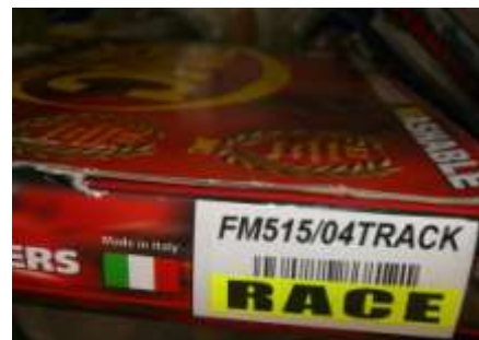
FILTOR DE AIRE COMPETICIÓN BMC PARA R6 08- 09. 60€ N.