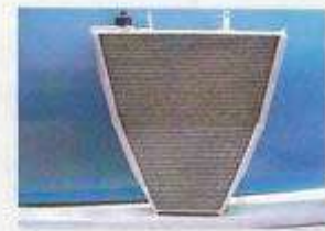
YAMAHA R1 04/06